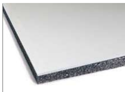
MUSTWALL 33 B